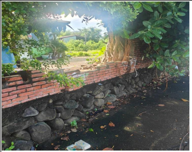
擋土牆年久失修，有礙觀瞻。