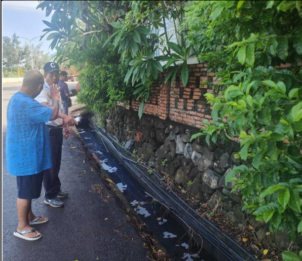
竹坑村第 5 鄰靠近省道之排水溝無法正常排水，水已往地面滲。