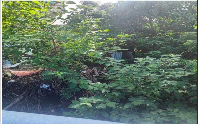
意象周遭環境需要整理維護，樹枝英需要修剪清理，使意象更加明顯。