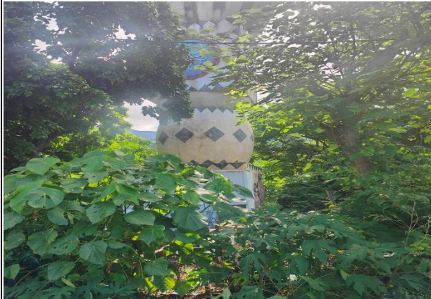
意象周遭環境需要整理維護，樹枝英需要修剪。