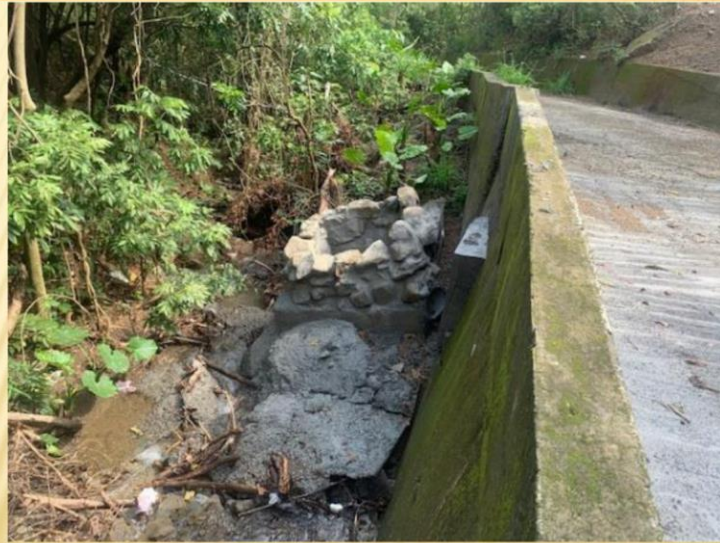
集水井基礎掏空、傾斜；目前改善中