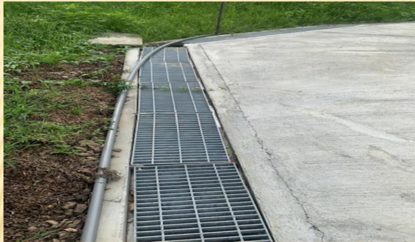
排水溝蓋未密合；目前改善中