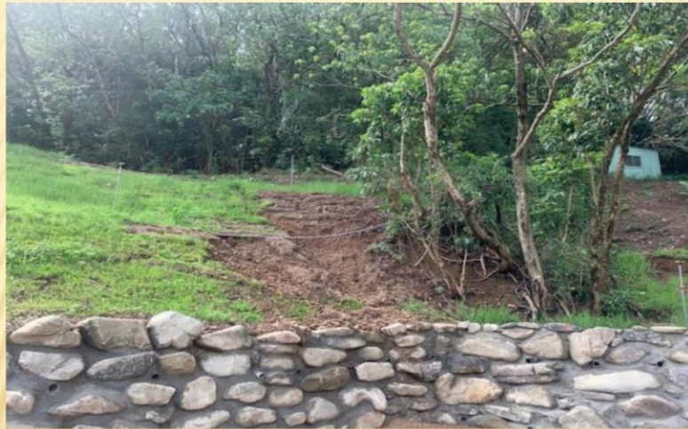
邊坡土石滑落、草皮流失；目前改善中