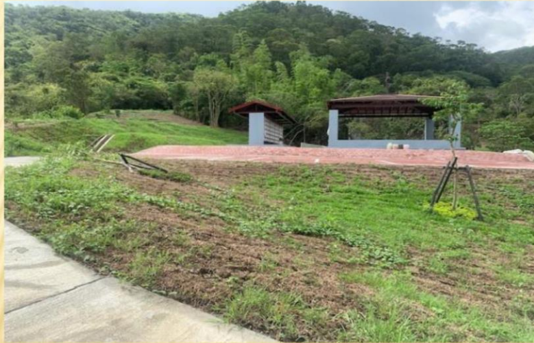
喬木傾倒、草皮流失；目前改善中