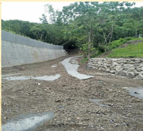
排水系統未完善；建議增設L型溝，以防止土石流入水泥路面