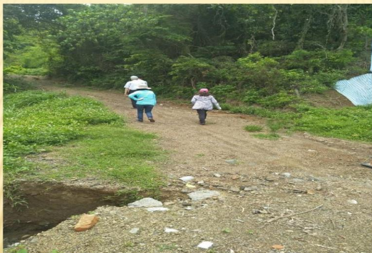
臨時納骨置放處水土保持不良；建議改善邊坡排水