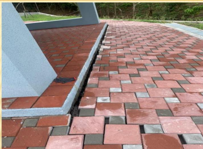
禮拜亭前高壓地坪基礎沉陷；目前改善中