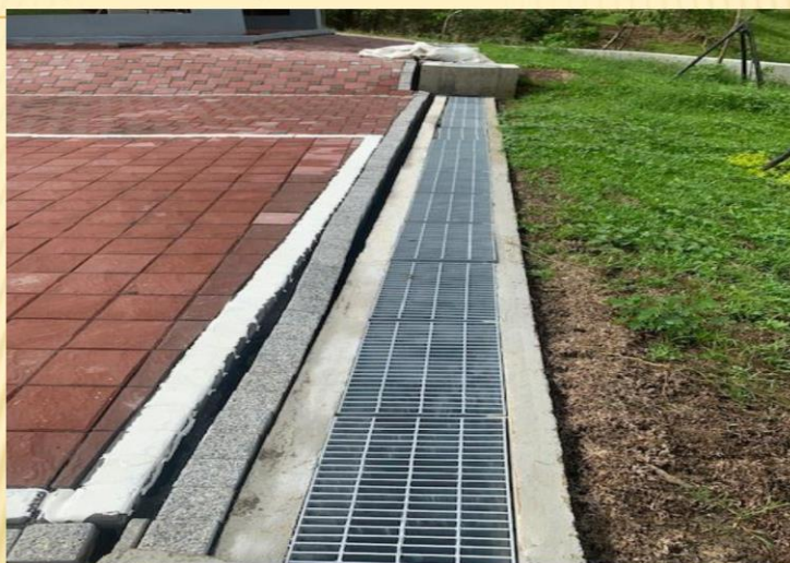
停車廣場高壓地坪基礎沉陷；目前改善中