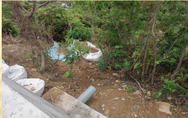
土石流入果園；目前改善中